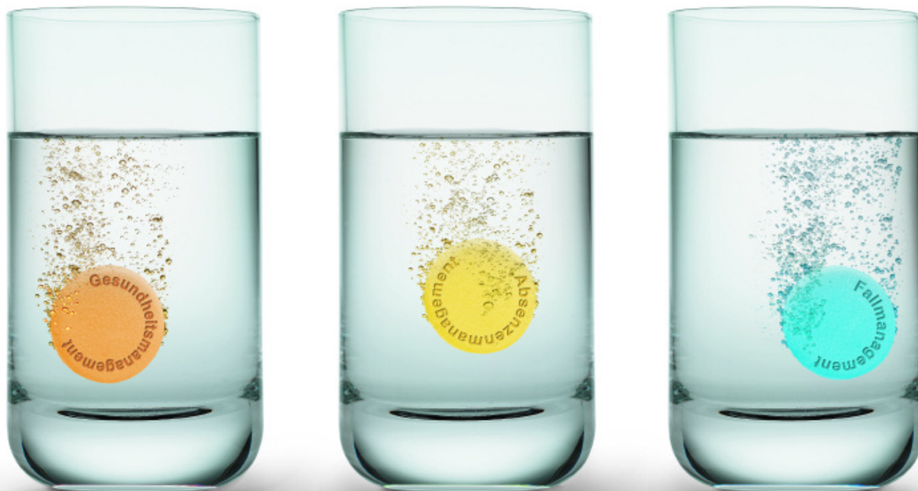
Il principio dei tre pilastri.

* Fonte: Ufficio federale di statistica Hans Zeltner, Absenzenmanagement Baldegger Verlag Aarau (2003)